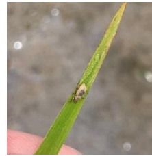
イネミズゾウムシ