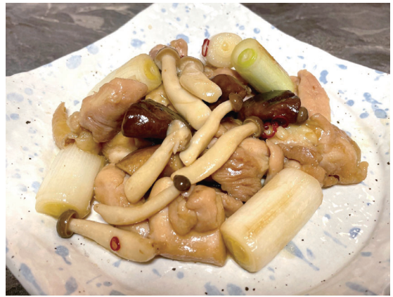
米こうじの酵素がお肉や魚をやわらかくして、旨味を引き出します！簡単でおいしい一品♪