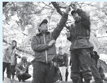
剪定のポイントを確認

ぶどう部会は11月10日、ルビーロマンなどの剪定講習会を開催。剪定は、次年度の収穫量や品質を向上するために非常に重要な作業です。