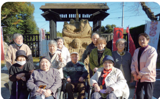
秋のドライブ♪ 妙成寺の砂像の前で記念写真を撮りました。