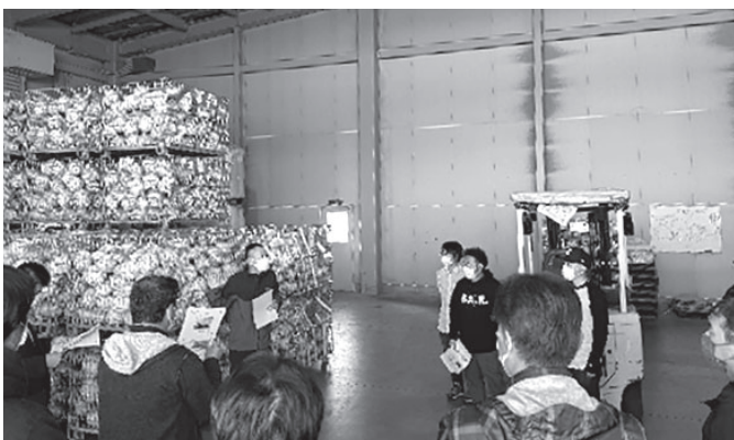
収穫したキャベツが積み上げられた(有)フクハラファームの倉庫

JAはくい担い手青年部は11月15日から1泊2日で視察研修を開催。滋賀県と福井県の先進農家を訪ね、農業所得拡大に向けた取り組みなどを視察。肥料事業などを展開する朝日アグリア関西工場では、堆肥地域循環の取り組みについて話しを伺い、工場を見学しました。