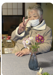
かわいい猫たちに出会って嬉しかったよ♪