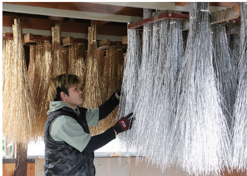
金銀に着色したペイント柳を乾燥させる様子

JAはくい押水花木部会は11月26日、クリスマスや正月を彩るペイント柳の出荷を開始。部会の農家3戸が生産・加工し、京都や大阪の市場を中心に、12月下旬までに約25万本の出荷を見込みます。