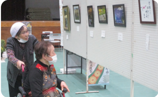
羽咋市の文化祭では、すばらしい作品展示を楽しみました。