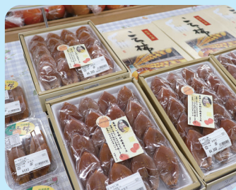
産直コーナーに並ぶ「干し柿」

羽咋市上中山の名産「干し柿」が11月下旬から並び始めました。産直農家が手作りする、心温まる味わいが魅力です。贈答用にもどうぞ。