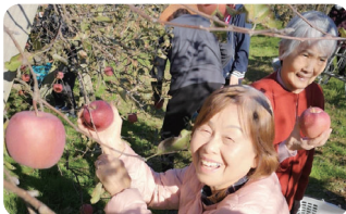
鹿島路りんご園で収穫体験。きれいなりんごに皆さん笑顔。