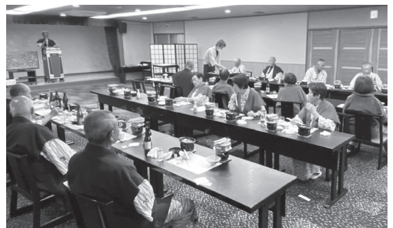
和気あいあいと会員相互の親睦を深めました

JAはくい共済友の会は11月13日、和倉温泉ホテル海望で懇親会を開きました。会員26人が参加して親睦を深め、温泉で日々の疲れを癒しました。