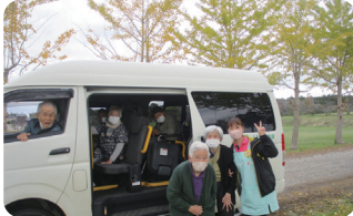
黄に色づき見頃を迎えた押水のイチョウ並木へ出かけました。