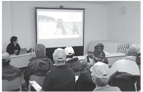
(株)トプコンによる「自動操舵システム」の製品説明

試乗会が行われました。作業機ほかの製品説明と実演会、同購入トラクタや各種馬力帯の直進アシスト機能を備えたトラクタ、自動操舵システムや高速耕起作業機ほかの製品説明と実演会、試乗会が行われました。