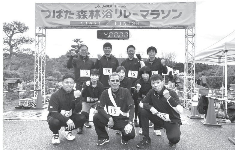
参加したJAはくいの役職員

邑知保育園の収穫祭では、園児による食育活動の発表がありました。「暑い日はシソジュースで乾杯」「お日様の光のできた干し芋は絶品」と、食材に愛着を持ち、元気よく発表する姿に、生産者も目を細めていました。生産者と消費者の交流は、地域社会の絆を深める重要な機会ですね。広報や女性部の活動を通して、食の大切さや地元農産物の魅力を発信したいと思います。(坂元)